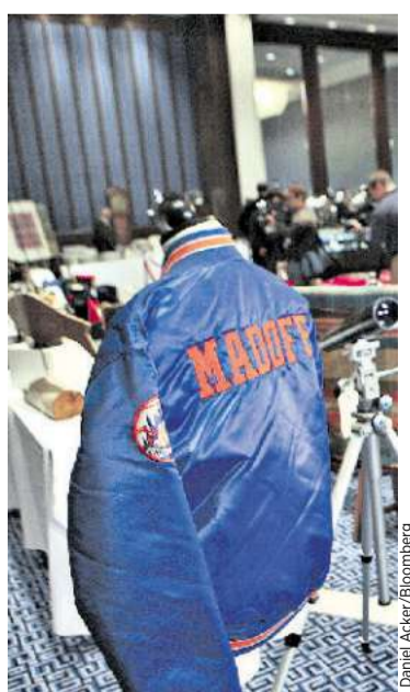
Versteigerung von Madoffs Besitz im November in New York: Hinterher sind alle schlauer.

Wie in Gottes Namen war es möglich, dass Bernard - überal nur Bernie genannt - Madoff die Finanzwelt