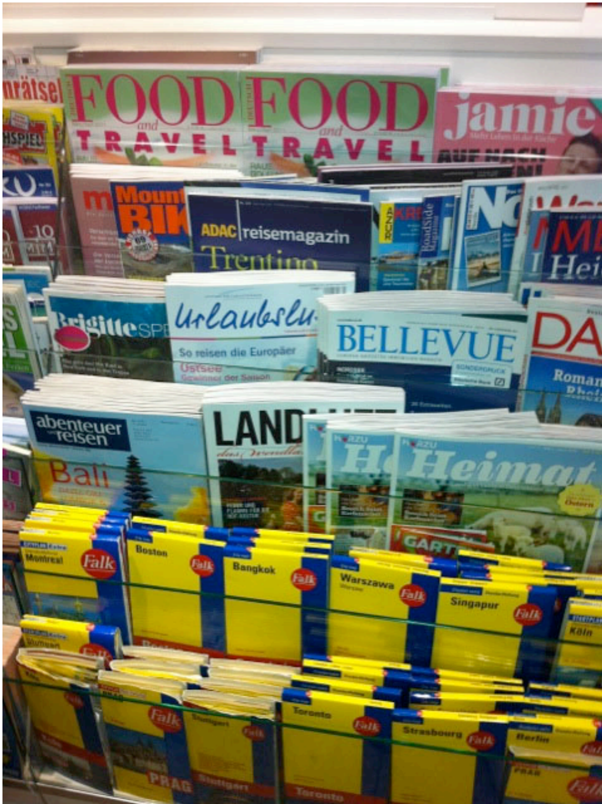
Die Tourismusanalyse 2011 zwischen weiteren beliebten Reisemagazinen